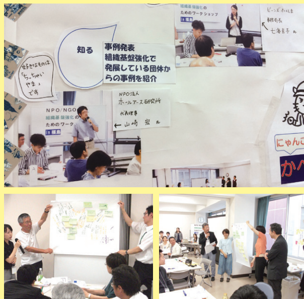
組織の課題を整理して全体で共有。